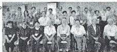
検討委員のみなさん