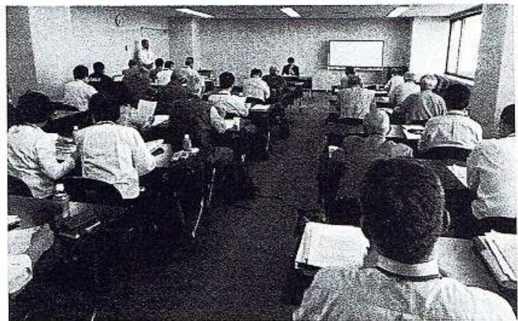
条例検討委員会での学識経験者との意見交換