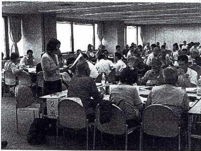
班ごとに検討した内容を発表し、全体で討議を重ねた条例検討委員会